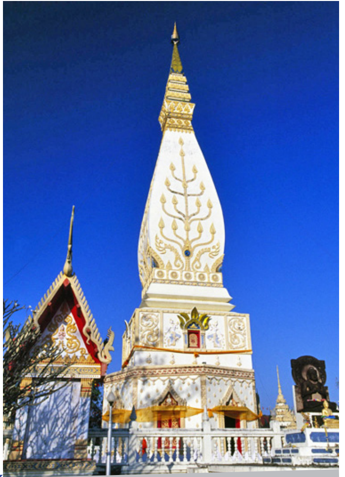
พระธาตุสุโขจะ องค์พระธาตุสุโขจะประกอบไปด้วย ดอกบัวบาน มีกลีบสามกลีบ สูง 1 เมตร อยู่รอบองค์พระธาตุ องค์พระธาตุมีความ สูงทั้งหมด 33 เมตร มีเศวตฉัตร 7 ชั้น

46. วัดธาตุมหาชัย : วัดโฆษาการาม ต.มหาชัย อ.ปลาปาก โทร. 01-4130019 บรรจุอัฐิธาตุ พระโกณฑัญญะพระโมคคัลลานะ พระสารีบุตร พระอานนท์ พระภัทสะ และพระอนุรุทธะ