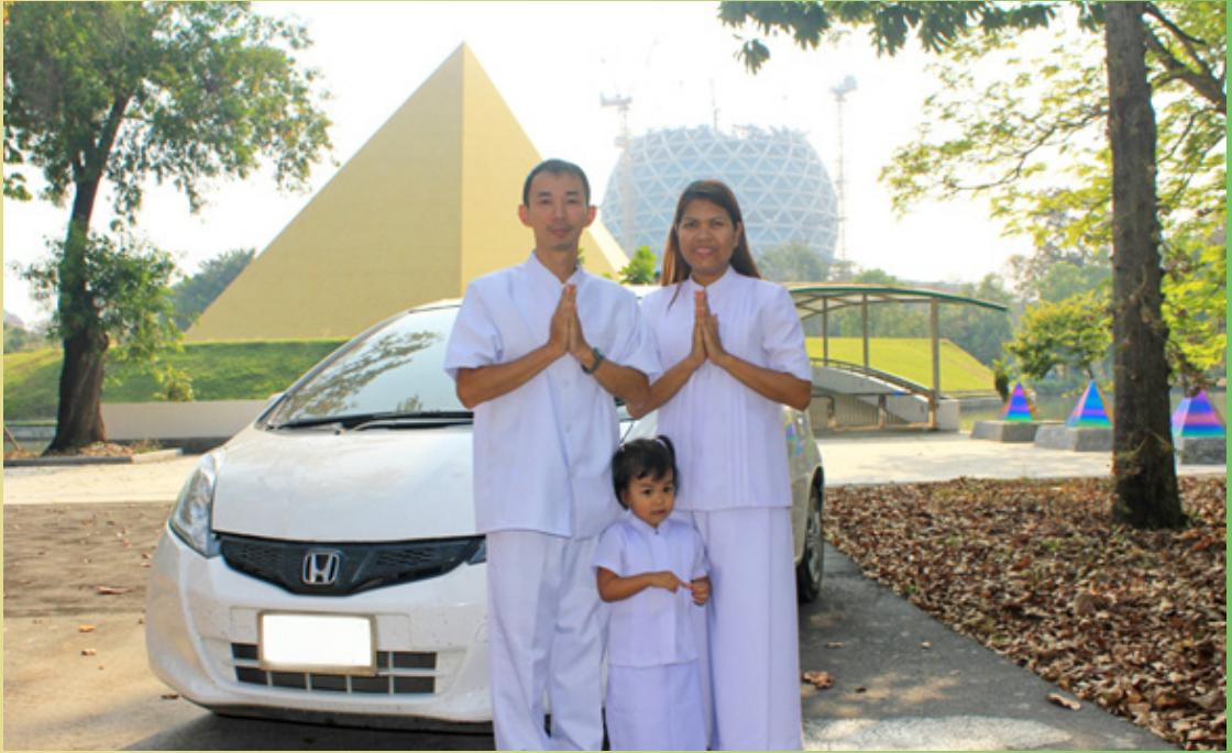
รถคันใหม่ที่ซื้อ เพื่อขับพาครอบครัวมาวัด