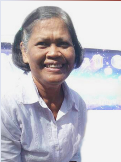
คุณแม่ของลูก ที่แนะนำให้อธิษฐานขอคุณยาย

หลวงพ่อกะ...เรื่องนี่ยังความปิติเบิกบานใจให้กับลูกเหลือเกินค่ะ แม่ลูกจะมาไม่ทันเจอคุณยาย แต่ลูกก็เหมือนได้เจอท่าน และได้สัมผัสถึงอากาศภาพความทรงจำของคุณยาย ก็เพราะด้วยความเมตตาของหลวงพ่อกะที่ลงสอนธรรมะผ่าน DMC ลูกขอสร้างบารมีตามติดหลวงพ่อกะไปจนถึงที่สุดแห่งธรรมะค่ะ และขอฝากความจริงใจของลูกผ่านบทเพลงนี้ค่ะ