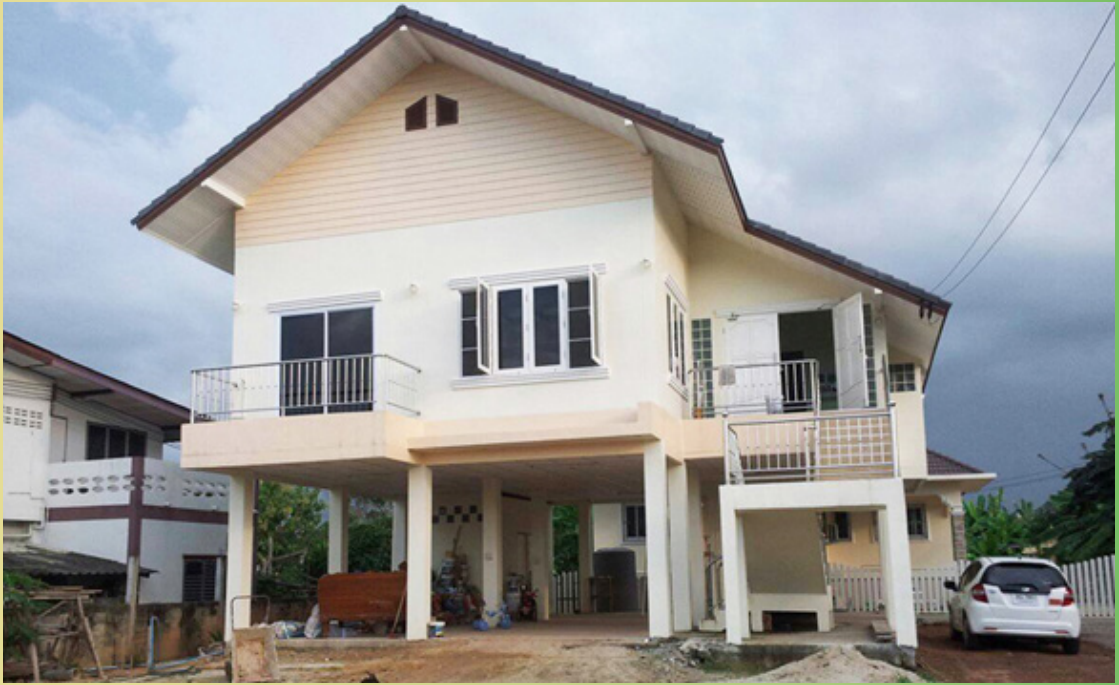
บ้านหลังใหม่ ที่ฝันว่าคุณยายมาเยี่ยม