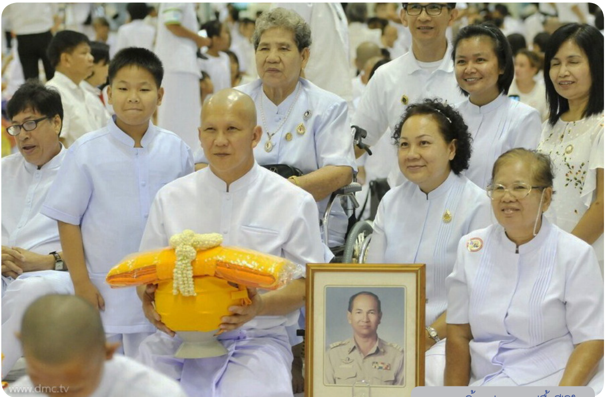
ภาพรอยยิ้มแห่งความปลื้มปีติใจ