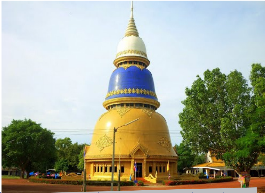
วัดพระธาตุวาโย (วัดห้วยน้ำทรัพย์) พระมหาธาตุเจดีย์ เจดีย์ทรงระฆัง ประดับด้วยกระจกสีเหลือง นำเงิน ขาว สูง 50 เมตร ฐานรอบเจดีย์กว้าง 45 เมตร

9. เนินพระ ต.ดอนยายหอม ไปทางใต้ขององค์พระ