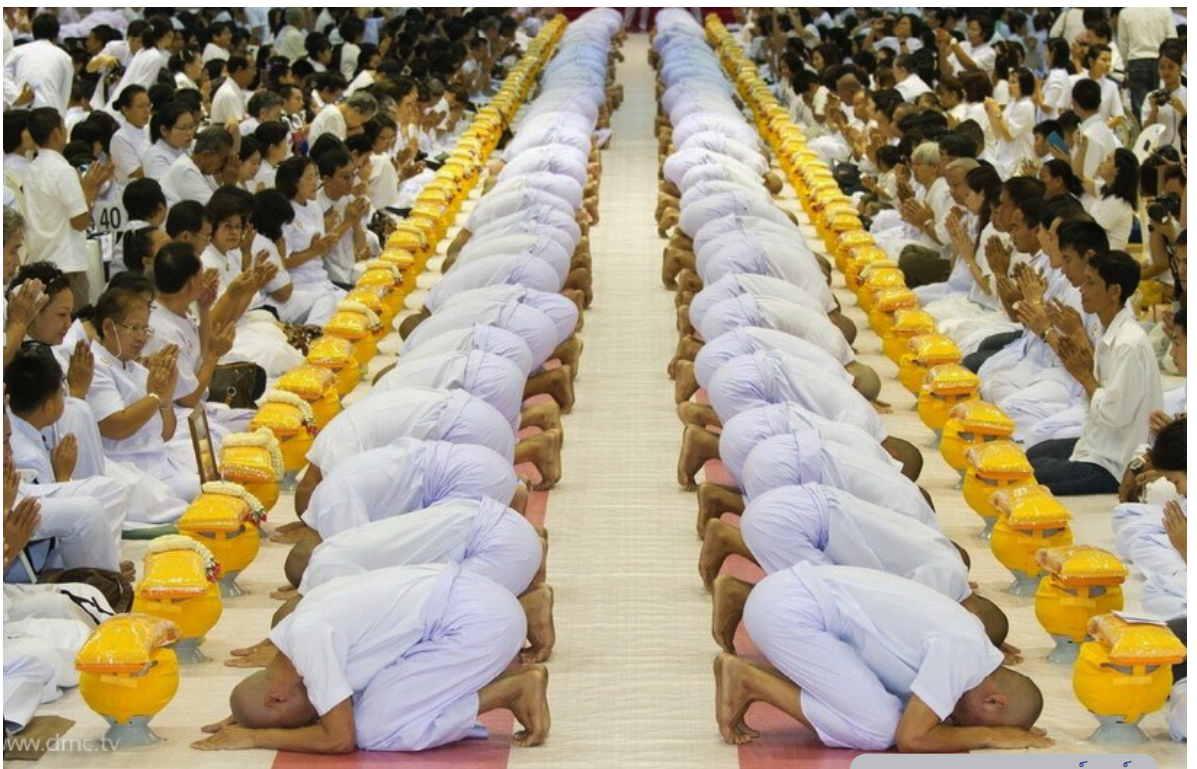
ภาพพิธีกรรมอันศักดิ์สิทธิ์