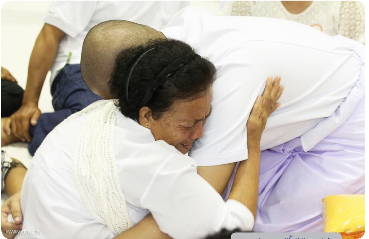
ภาพแห่งความปลื้มปิติและอ่อนใจ