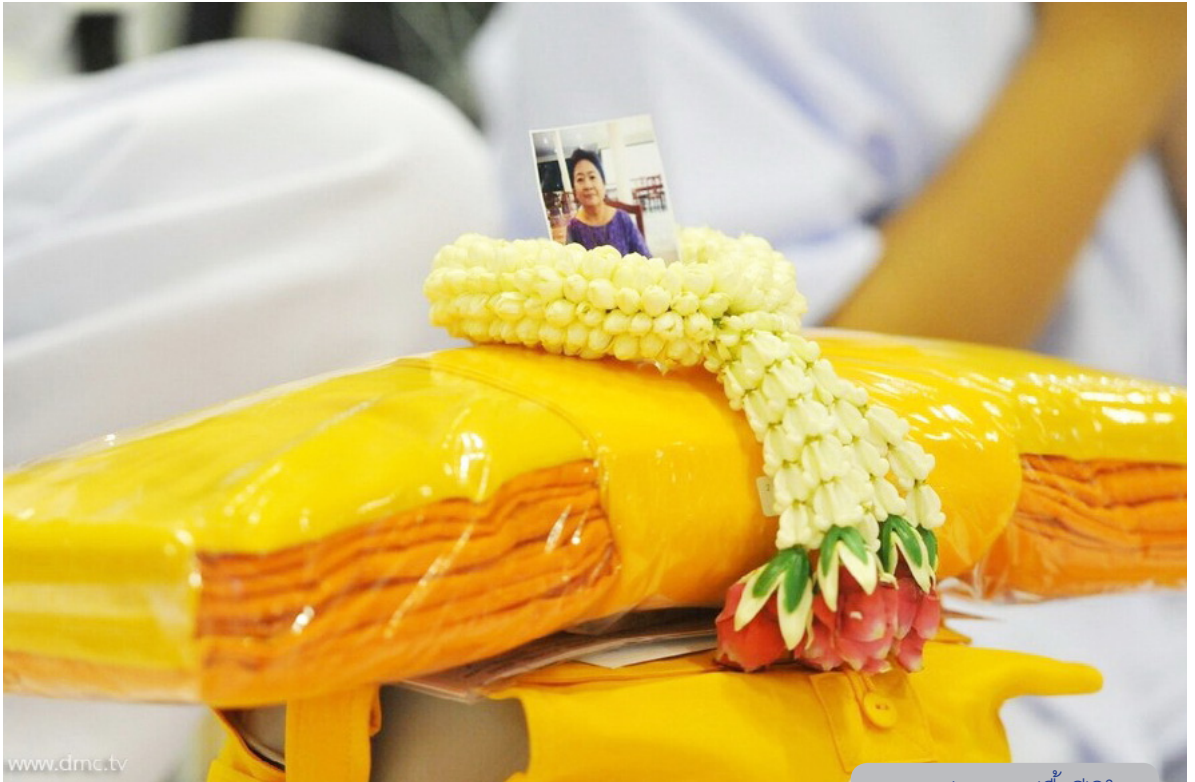
ภาพแห่งความปลื้มปีติใจ