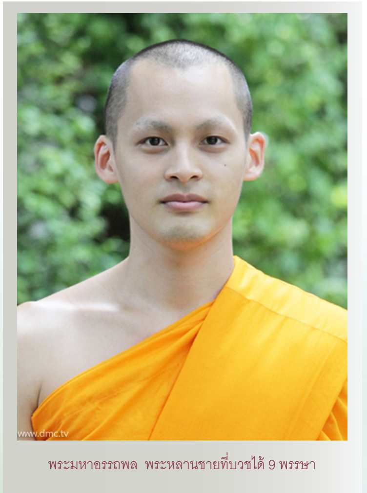
พระมหาอรรถพล พระหลานชายที่บวชได้ 9 พรรษา