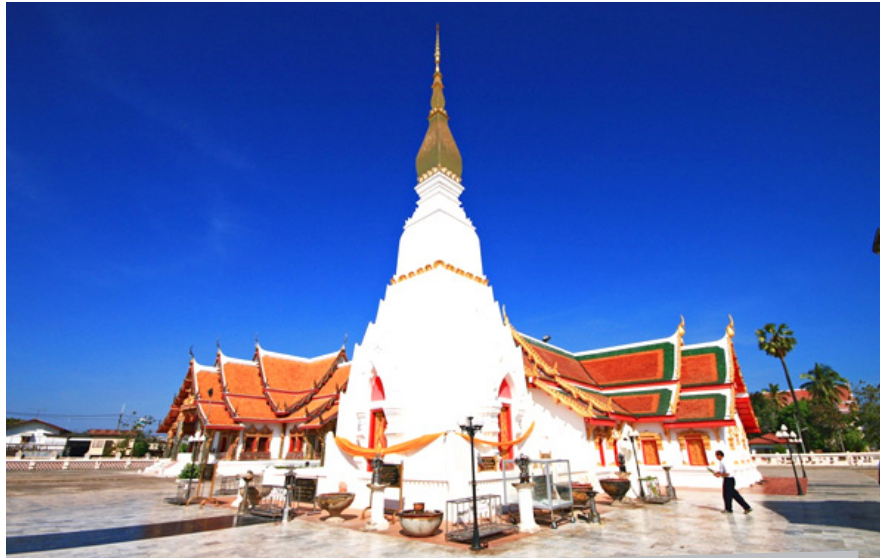
วัดพระธาตุเชิงชุมวรวิหาร ตั้งอยู่ในเขตเทศบาลเมืองสกลนคร ตำบลธาตุเชิงชุม อำเภอเมือง จังหวัดสกลนคร