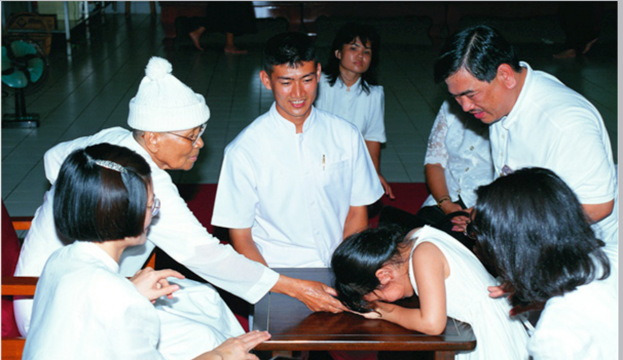
ภาพผมสมัยก่อนที่ได้ถ่ายกับคุณยายครับ