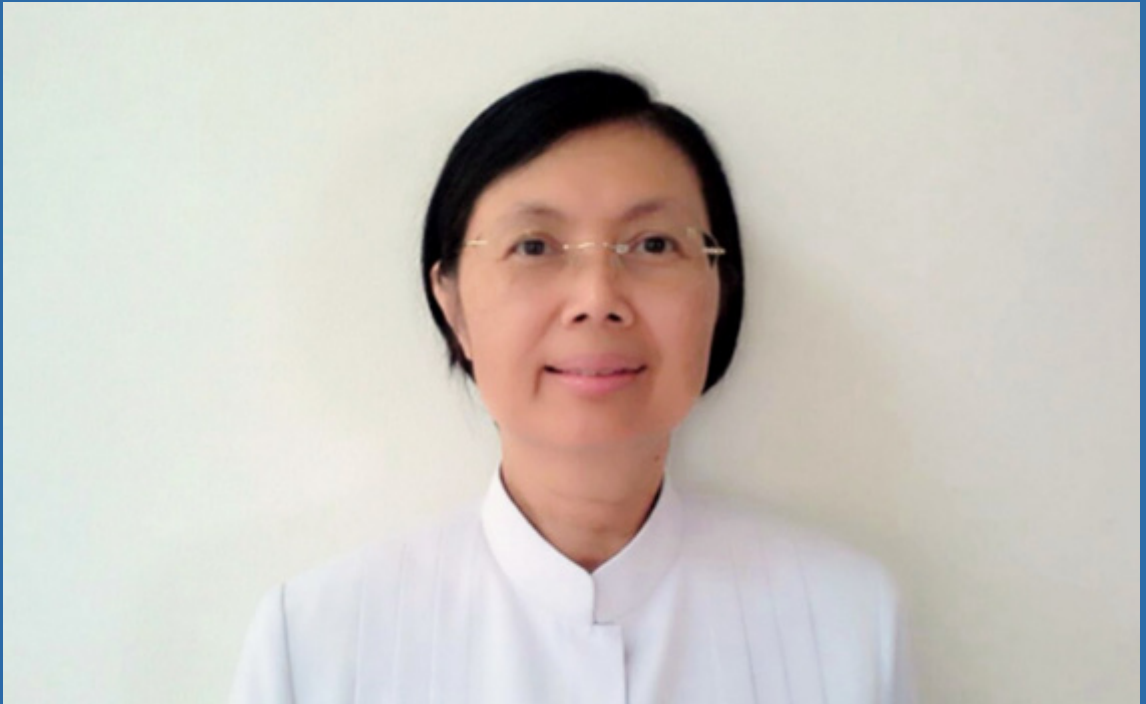
กัลฯ ภาวดี ผลาเกตุ

กระบุง ก็เลสท่วมตัว ตายจะไปไม่รอด เวลาที่มีเรื่อง กระทบ พอใจซุนก็ไปดูคนบาปเก่าเรามา ของเก่า เราทั้งนั้น ไม่ต้องไปดูคนอื่น ให้ถามตัวเองว่า..จะ เอาอีกไหม จะให้เรื่องนี้ตามไปภพชาติหน้าอีกไหม ถ้าไม่อยากให้ตามไป ชาตินี้ก็หยุดซะ ให้สิ้นวาทสนา กันไป จะได้ไม่มีศัตรูในวัฏฏะ ให้ดับที่เหตุ คือ ใจ ของเรา ถ้าเหตุไม่มี ผลก็ไม่มี ใครทำใจใสได้ก่อน คนนั้นชนะ ดูอย่างยาย ยายไม่ติดใครเลย ชาติหน้า มารตามยายไม่ได้แล้ว”