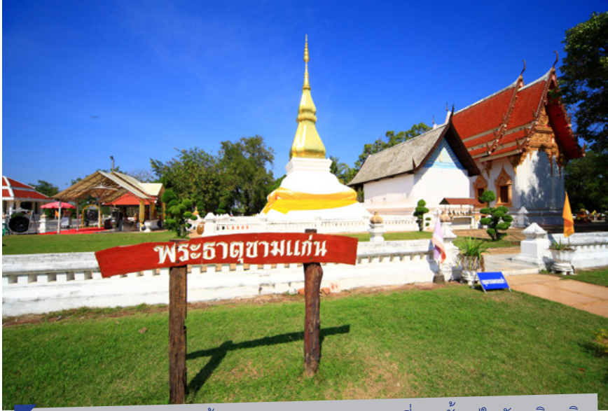
พระธาตุขามแก่น สร้างขึ้นประมาณต้นพุทธศตวรรษที่ 25 ตั้งอยู่ในวัดเจติยภูมิ ตำบลบ้านขาม อำเภอเมือง ขอนแก่น

34. วัดมหาชัย (วัดมหาธาตุเจติย์) : บ.หนองบัว ม.9 ต.ลำภู หนองบัวลำภู อ.เมือง 39000 โทร.042-311232 (พระพุทธรูปโบราณ และ ปรางค์ 2 องค์) เดิมชื่อ วัดมหาธาตุไทรยะภูมิ เดิมมีพระธาตุและหอไตร กลางน้ำอายุกว่า 100 ปี มีหนังสือโบราณเป็นภาษา ขอมแต่งเป็นเรื่องราว ไว้มากมาย 35. วัดบรรณิมา : บ.น้ำพัน