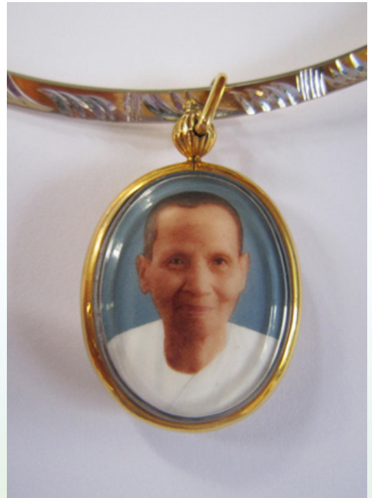
ลોકเกตคุณยาย ที่ลูกใส่กรอบห้อยติดตัวมา 17 ปีคะ

และที่สำคัญ...ตั้งแต่ลูกห้อยลોકเกตคุณยาย ก็เหมือนมีคุณยายคอยตามดูแลลูกตลอดเวลาจริงๆ และลูกมั่นใจว่า คุณยายอยู่ใกล้เรา จนตอนนี้ลูกเข้าใจแล้วคะว่า..ทำไมคุณยายท่านถึงเน้นย้ำกับหลวงพี่หนูว่า...เวลาไปไหนให้เอาลોકเกตท่านติดตัวไปด้วย เพราะคุณยายท่านจะได้ตามคุ้มครองดูแลลูกหลานของท่านแบบนี้เองคะ