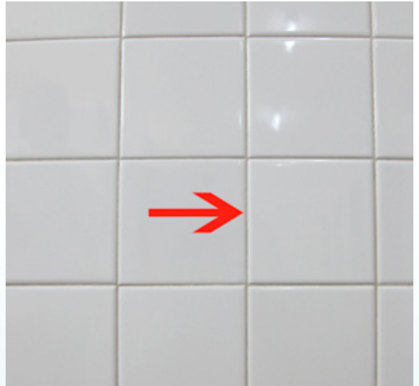
ร่องระหว่างกระเบื้องแต่ละแผ่น ที่คุณยายให้เช็ดน้ำให้แห้ง

จากนั้นก็ให้ใช้ผ้าแห้งเช็ดพื้นห้องน้ำจนแห้ง