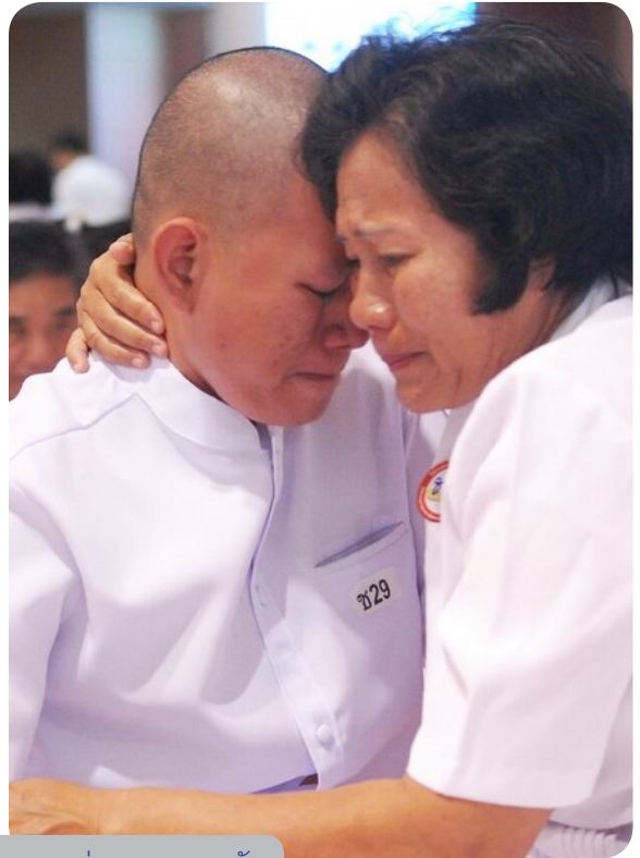
ภาพของความรักและความอบอุ่นจากครอบครัว