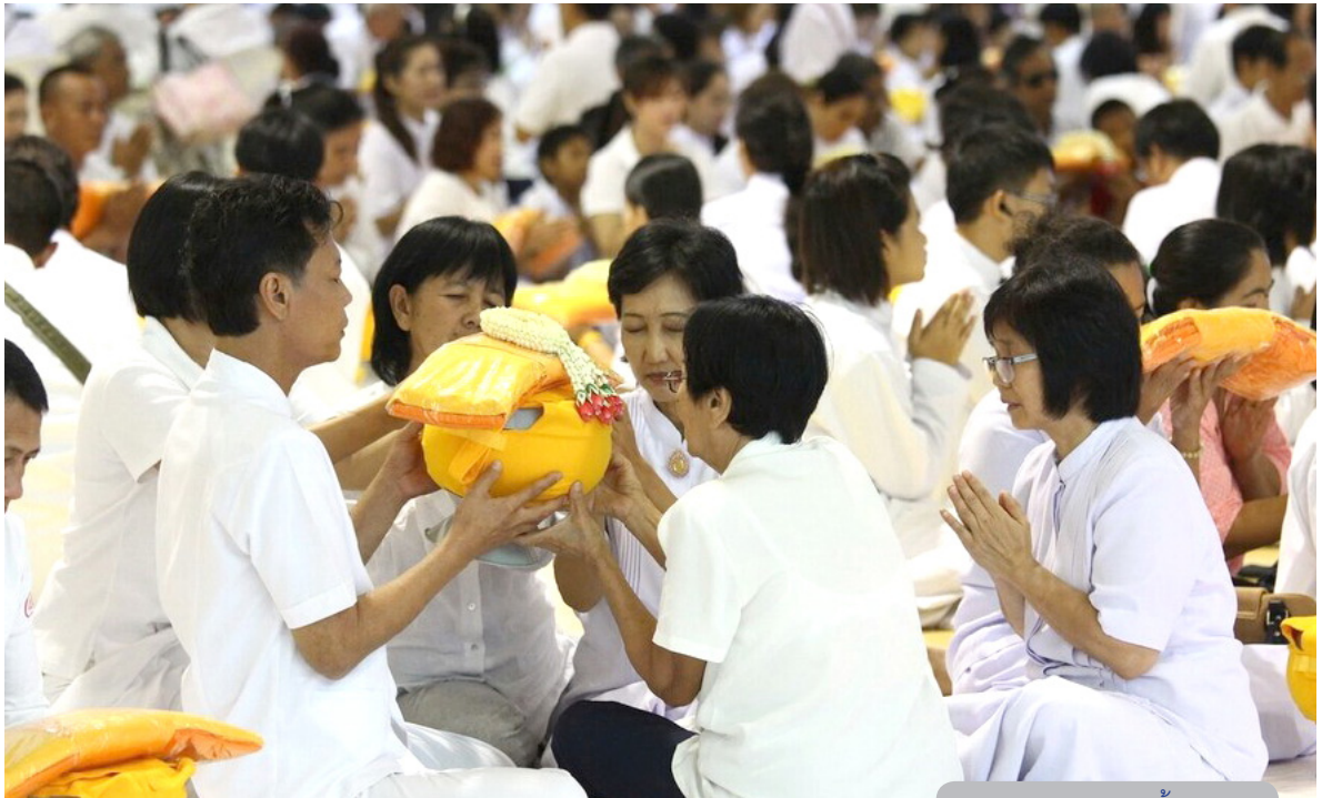
ภาพแห่งความปลื้มปิติใจ