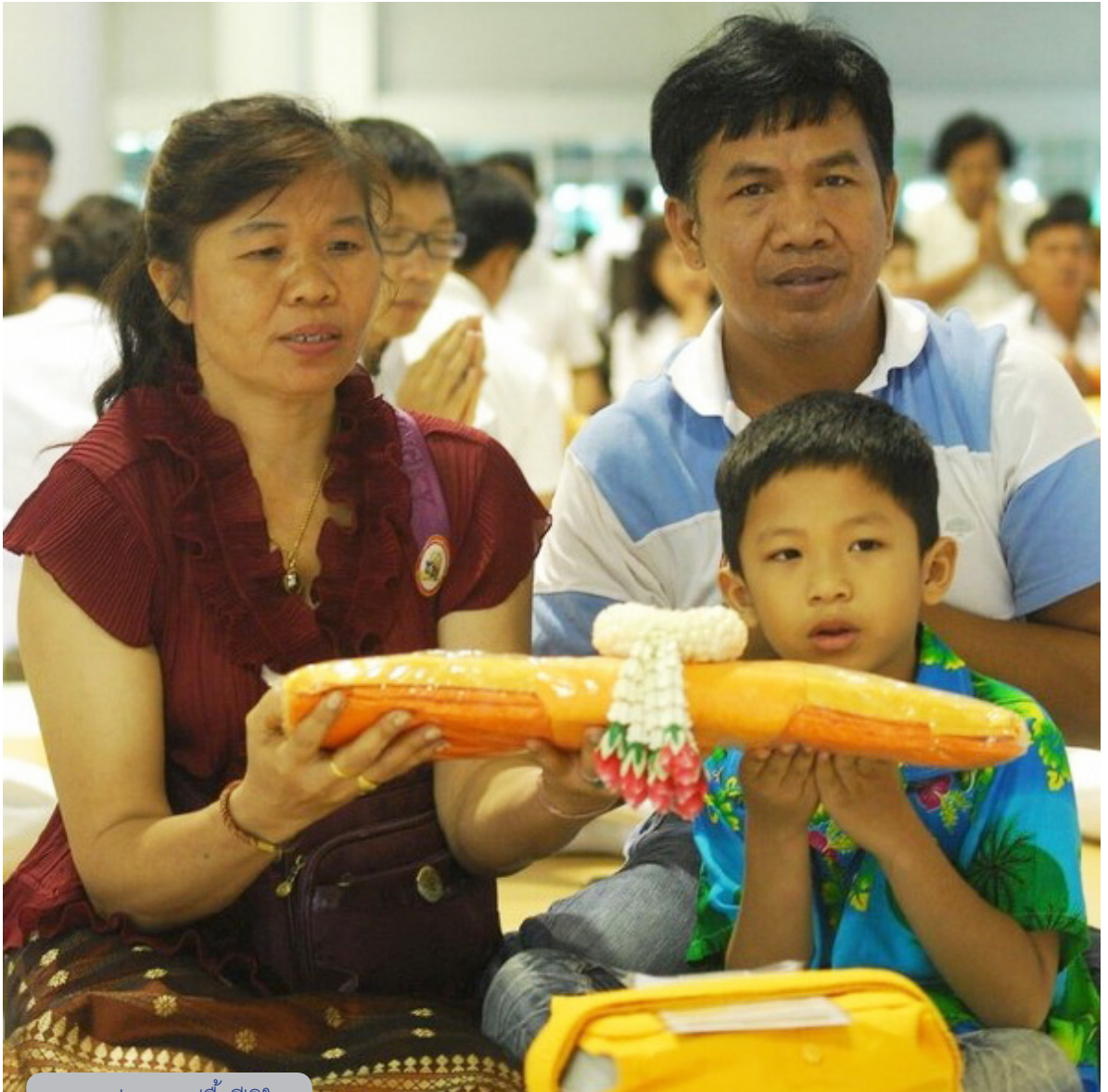
ภาพแห่งความปลื้มปิติใจ