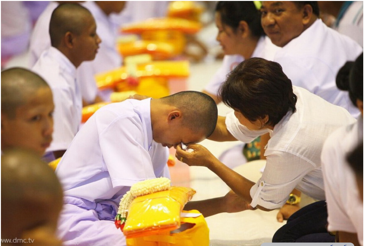
ภาพพิธีกรรมอันศักดิ์สิทธิ์