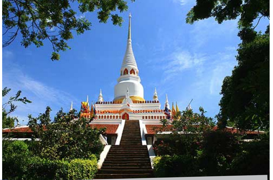
วัดพะโคะ เป็นวัดจำพรรษาของ สมเด็จพระโคะหรือหลวงพ่อทวด เหยียบน้ำทะเลจืด ซึ่งประชาชนให้ความนับถือเป็นอันมาก

35. วัดพระบรมธาตุไชยา 50 ม.3 ต. ในเวียง อ. ไชยา (ทรงมณฑปศิลปปะศรีวิชัยสูง 24 เมตร)