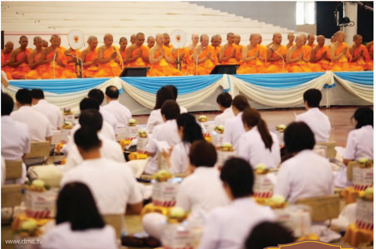
คณะสงฆ์ทำพิธีสวด ธัมมจักกัปปวัตตนสูตร