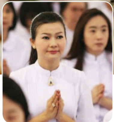
พิธีถวายกองทุน รักษาพระภิกษุ-สามเณรอาพาธ