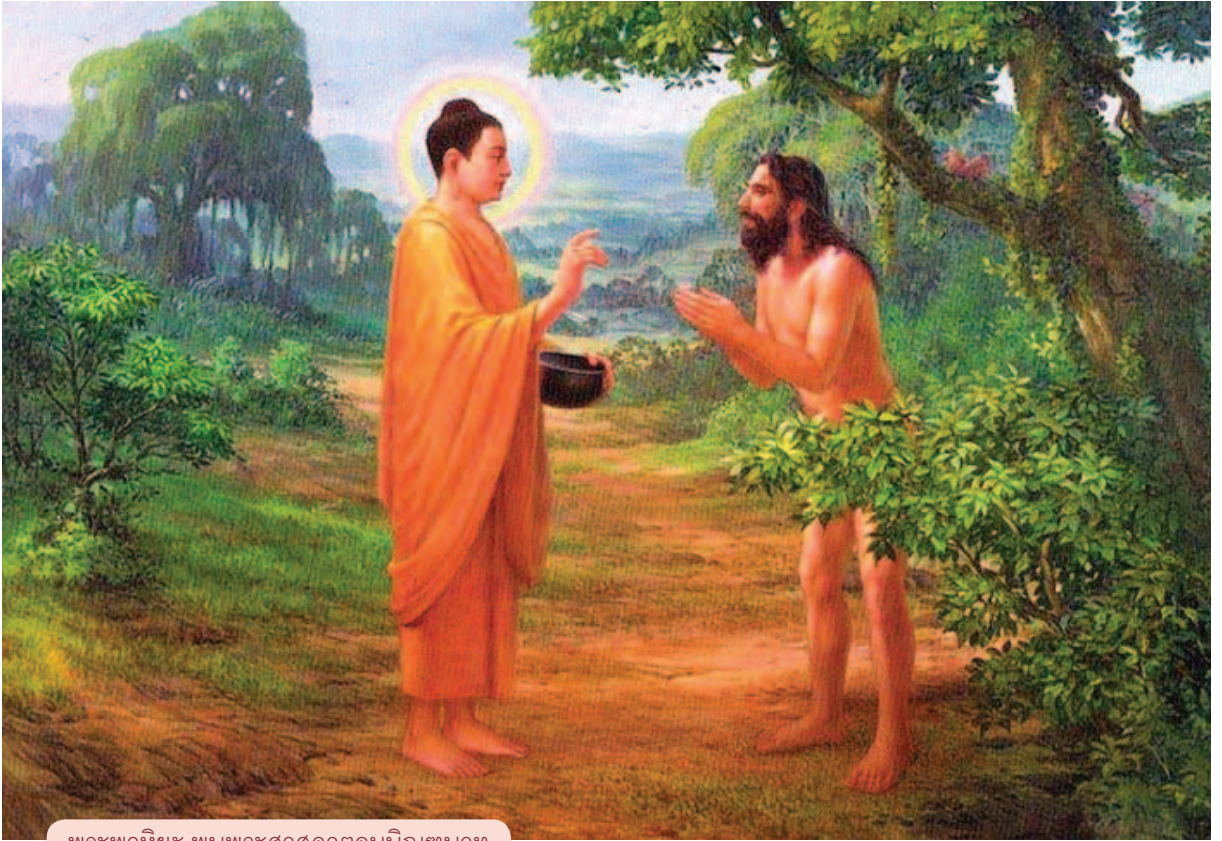
พระพาหิยะ พบพระศาสดาตอนบินตบาท

ก็ได้ออกบวช ในเวลาต่อมาเมื่อพระศาสนาถึงยุค ใกล้จะเสื่อมสิ้นลง ท่านได้เห็นความเสื่อมในการ ประพฤติกปฏิบัติของพุทธบริษัท 4 ก็เกิดความสังเวช สลดใจ จึงชักชวนเพื่อนภิกษุอีก 6 รูป พวกกันขึ้นไป ปฏิบัติธรรมบนภูเขาสูงชันลูกหนึ่ง ได้ตัดไม้ไผ่มา ทำเป็นบันได เพื่อปีนขึ้นไปตามหน้าผาของภูเขานั้น เมื่อถึงยอดเขานั้นแล้ว ก็ตั้งใจว่า ถ้าไม่ได้สำเร็จ มรรคผลอย่างใดอย่างหนึ่ง ก็จะไม่ยอมสละชีวิตอยู่ บนยอดเขานี้ และได้ผลัดบันไดให้ตกลงหน้าผาไป แล้วพระภิกษุแต่ละรูปก็ต่างบำเพ็ญสมณธรรมอยู่ บนนั้น