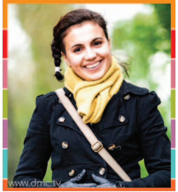
พีชเชเจนต์อังกา โยกุลเสศคุ (ลิตเตลอังกฤษ)