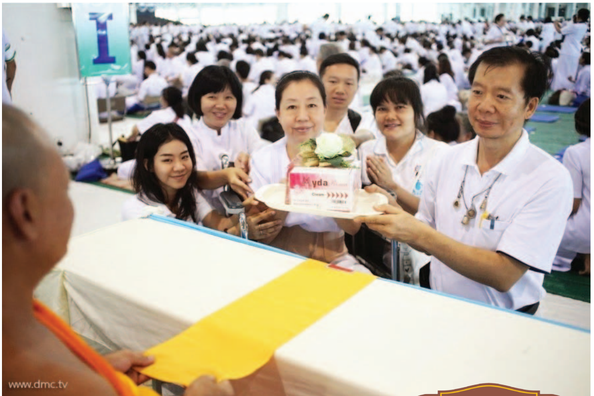
พิธีถวายกองทุน รักษาพระภิกษุ-สามเณรอาพาธ