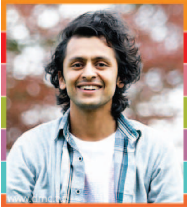
พีชเชเจนต์ชานโตส กิริ