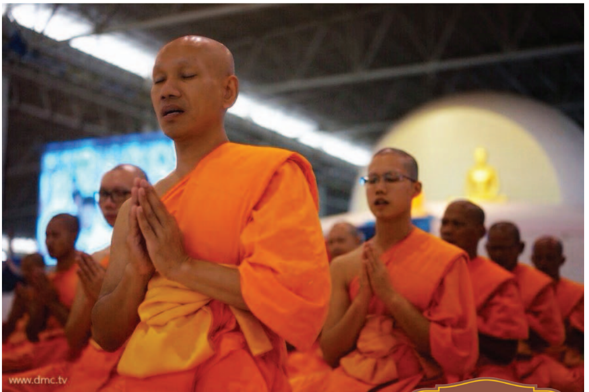
คณะสงฆ์ทำพิธีสวด ธัมมจักกัปปวัตตนสูตร