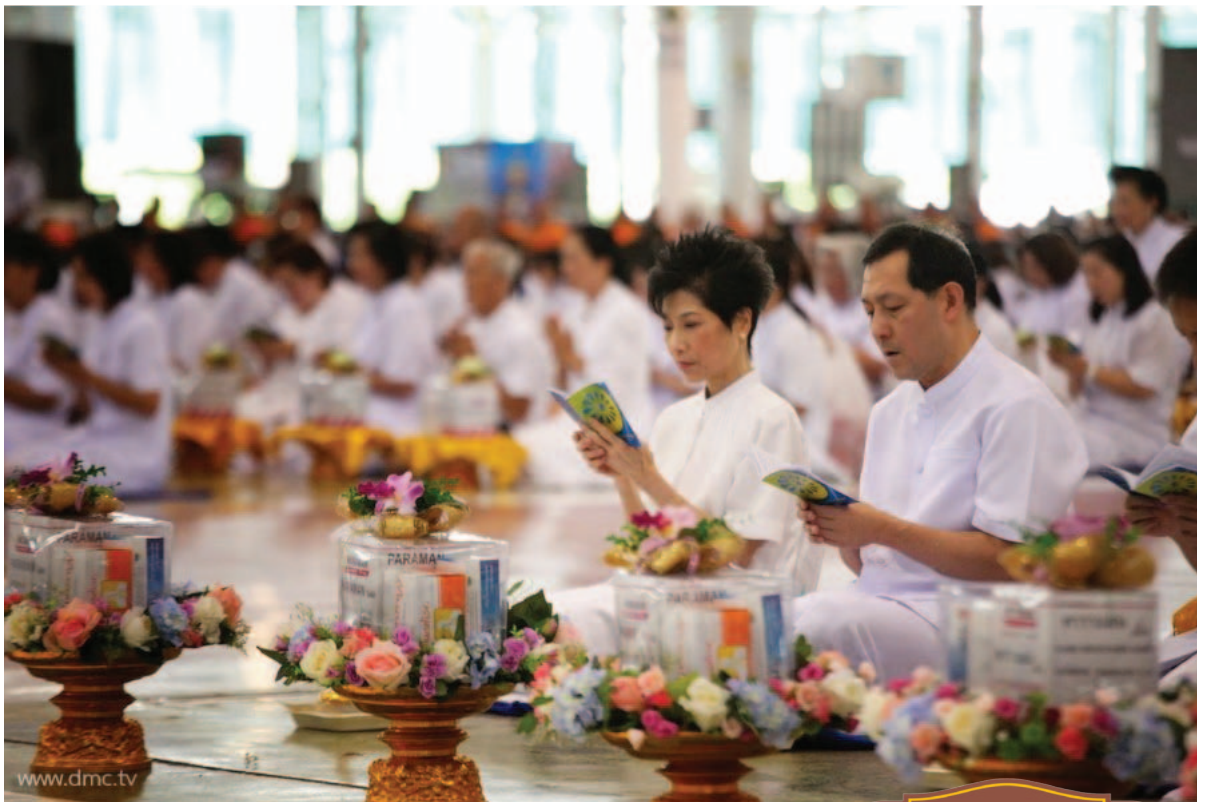
สาธุชนร่วมสวดมนต์ ธัมมจักกัปปวัตตนสูตร