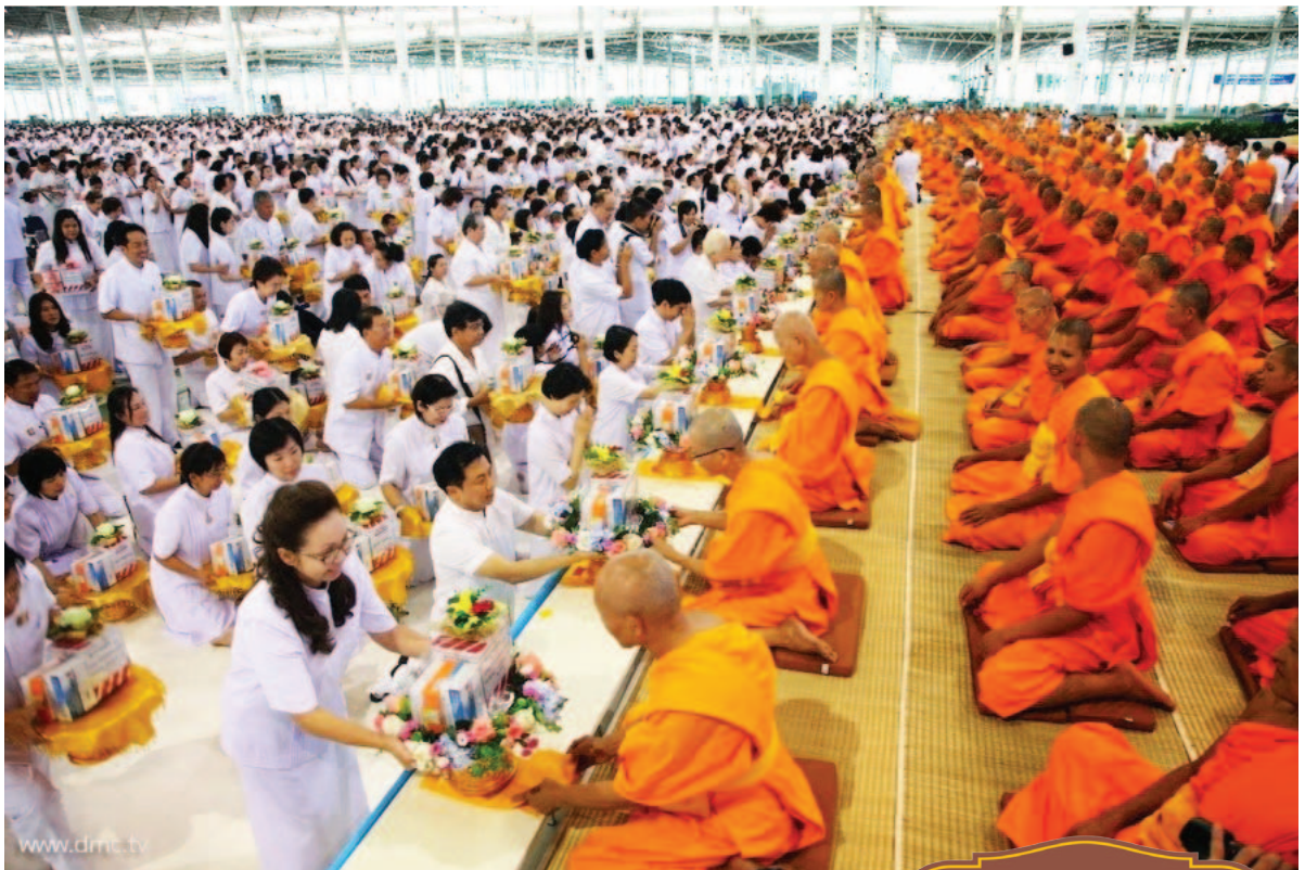
พิธีถวายกองทุน รักษาพระภิกษุ-สามเณรอาพาธ