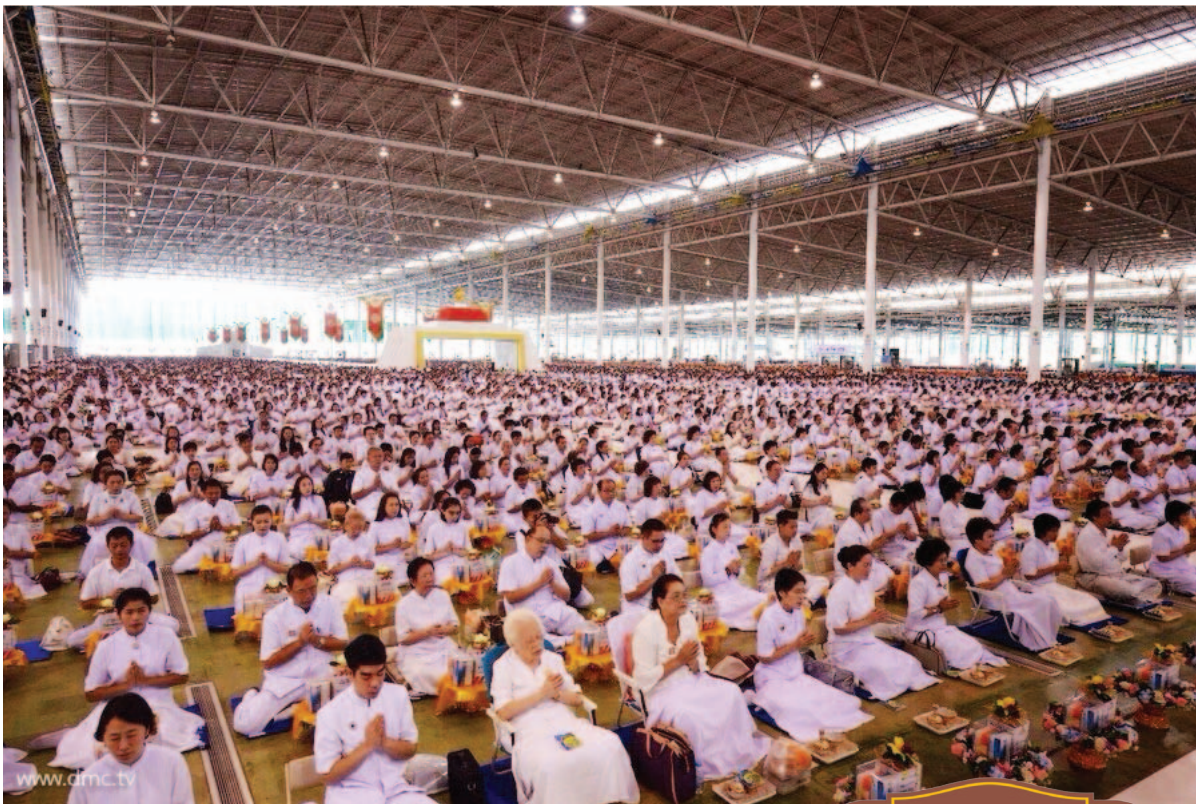
สาธุชนร่วมสวดมนต์ ธัมมจักกัปปวัตตนสูตร