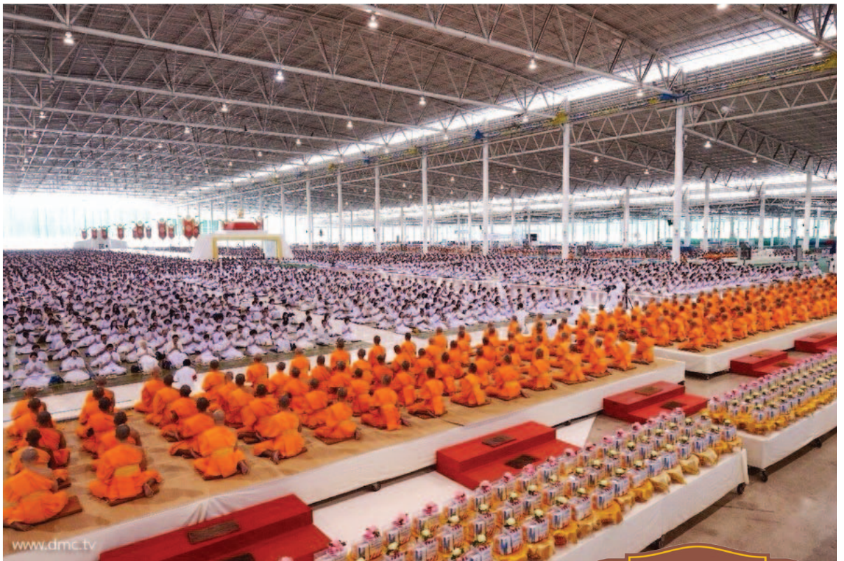
คณะสงฆ์ทำพิธีสวด ธัมมจักกัปปวัตตนสูตร