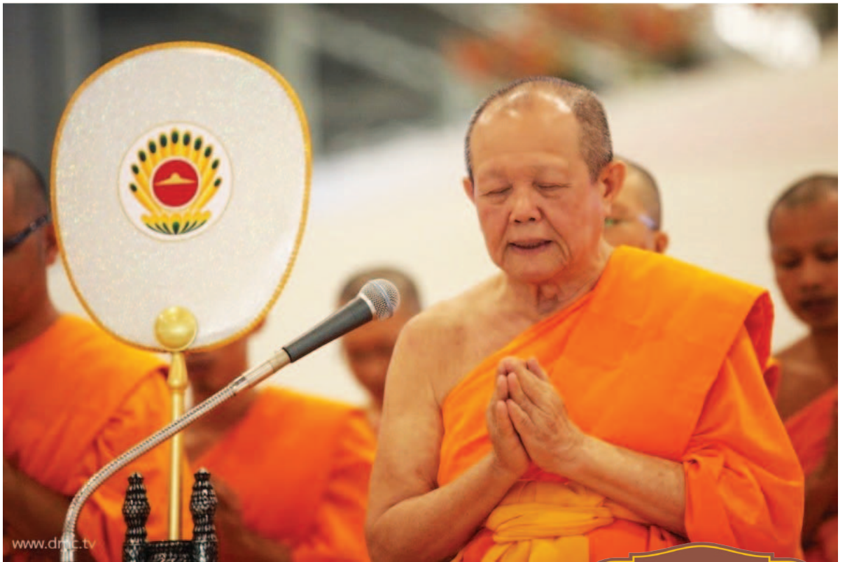
ภาพงานพิธีในตอนสาย