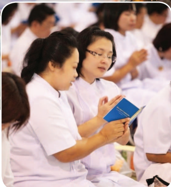
สาธุชนร่วมสวดมนต์ ธัมมจักกัปปวัตตนสูตร