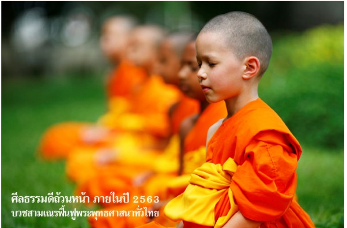
ศีลธรรมดีถ้วนหน้า ภายในปี 2563 บวชสามเณรฟื้นฟูพระพุทธศาสนาทั่วโลก