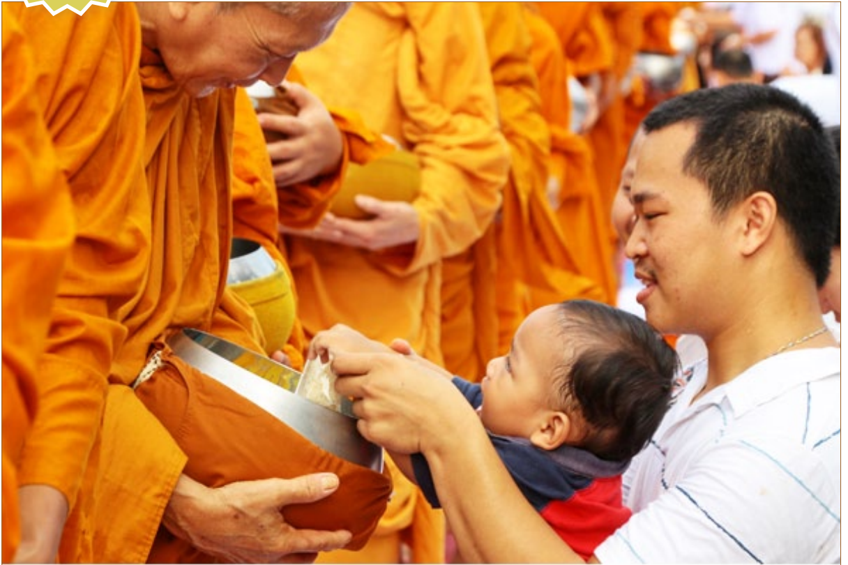
ศีลธรรมดีถ้วนหน้า ภายในปี 2563