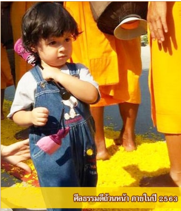
ศีลธรรมดีถ้วนหน้า ภายในปี 2563

- ชาวไทยมีน้ำใจโอบอ้อมอารีต่อกัน เอื้อเฟื้อ แบ่งปัน ผู้คนยิ้มแย้มแจ่มใส มีความสุข สมนาม “สยามเมืองยิ้ม”